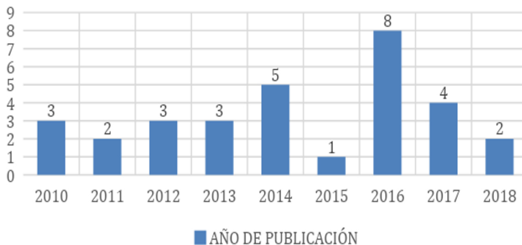
Figura 2. Año de publicación